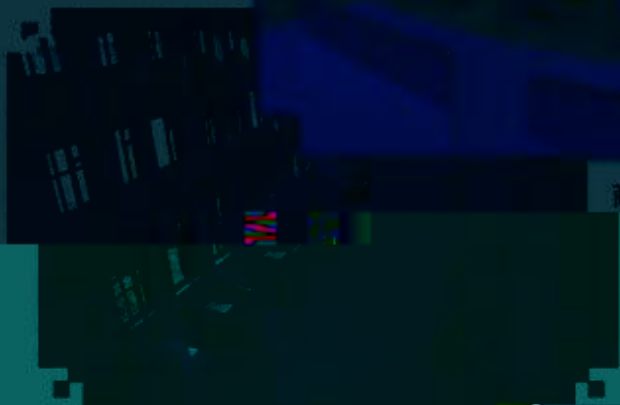
商贸管理类专业 综合训练场所